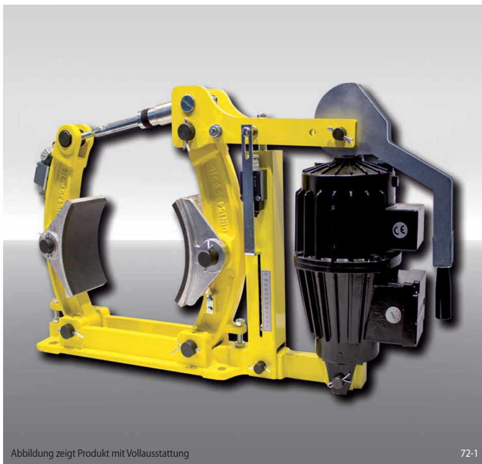
Abbildung zeigt Produkt mit Vollausrüstung

federbetätigt – elektrohydraulisch gelüftet Trommelbremse nach DIN 15 435